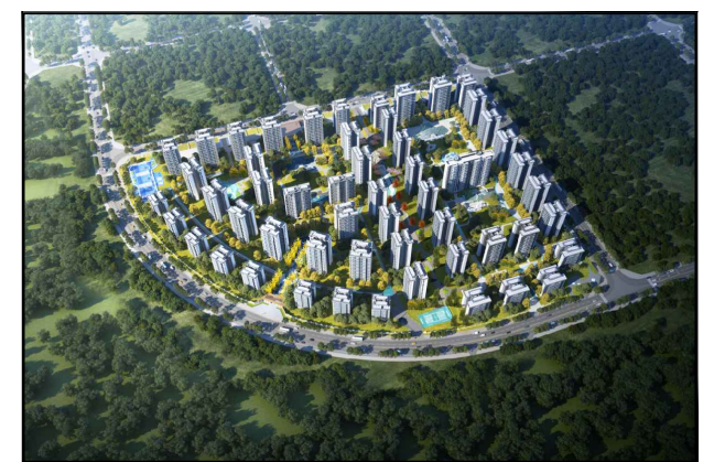
调整后鸟瞰效果图

备注：本次仅对两相邻项目围墙进行调整（即取消两项目共用部分的围墙），其他内容按照原审批规划方案不变。