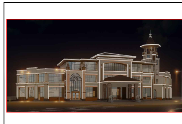
改造后夜间效果图